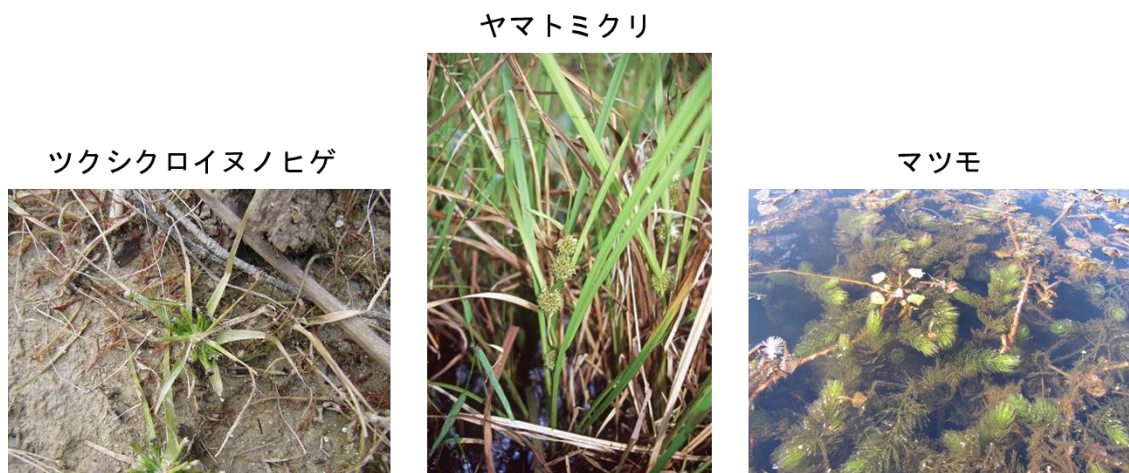
写真2. 個体群の回復確率が 0.4 を超えた 3 種

62 種の水生植物のうち、回復確率が 0.2 を超えたのは 25 種（40.3%）、0.4 を超えたのは 3 種（4.8%、写真 2）にのぼったことから、前年に地上個体群が不在であっても翌年以降に埋土種子から再生する種が比較的多いことがわかりました。