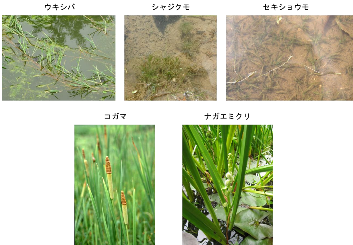
写真3. 100年後の絶滅確率が70%を超えていた種

また、水生植物種ごとの埋土種子からの再生を考慮して保護対象とする池を選定した場合、それらを考慮しない場合に比べて少ない数のため池でより多くの種を効果的に保全できることが明らかになりました（表1）。再生ありシナリオでは、すべての水生植物種の保全を達成するために4つの池を保護する必要があることに対し、一時点シナリオと再生なしシナリオではそれぞれ13、10の池を保護する必要があることがわかりました（表1）。