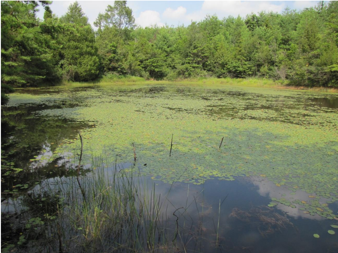
写真1. 東広島市の山間部にあるため池に生育する水生植物