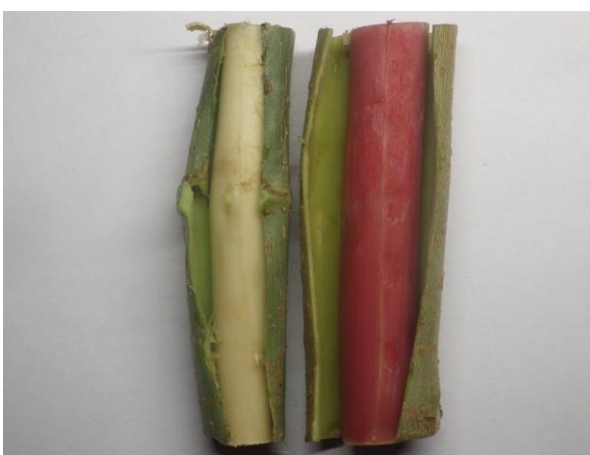
図2：剥皮した赤材桑の枝（右） 左は対照とした通常品種