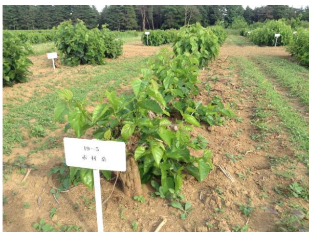
図1：圃場で生育する赤材桑

注3）リグニン： 植物の細胞壁の主要な構成成分であり、細胞壁を固く丈夫な構造に保つための高分子。生体内では、アミノ酸であるフェニルアラニンを経由して合成されるコニフェリルアルコール等のケイ皮アルコール類が重合して生成する。